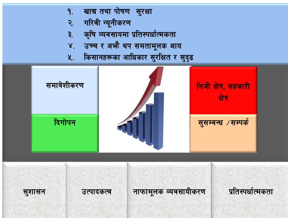
चित्र १: कृषि विकास रणनीतिको रणनीतिक रूपरेखा

कृषि विकास रणनीतिको परिकल्पना (Vision) पूर्ण गर्नलाई चार रणनीतिक सम्भागहरू: सुशासन, उत्पादकत्व, नाफामूलक व्यवसायीकरण र प्रतिस्पर्धी क्षमताको माध्यम द्वारा कृषि क्षेत्रको द्रुत विकास गरिने उल्लेख छ । समावेशीकरण (सामाजिक तथा भौगोलिक दुवै) प्रवर्द्धन, प्रतिस्पर्धी क्षमता, दिगोपन (प्राकृतिक स्रोत साधन तथा आर्थिक दुवै), निजी तथा सहकारी क्षेत्रको विकास र बजार पूर्वाधारको सञ्जाल (उदाहरणका लागि कृषि सडक, सडकलन केन्द्रहरू, प्याकेजिङ्ग घरहरू, बजार केन्द्रहरू), सूचनाका पूर्वाधार तथा सूचना सञ्चार प्रविधि, र ऊर्जा पूर्वाधारहरू (उदाहरणका लागि ग्रामीण विद्युतीकरण, नवीकरणीय एवं वैकल्पिक ऊर्जाका स्रोतहरू) मार्फत् विकासलाई अगाडि बढाइने छ । समावेशी, दिगो, बहु-क्षेत्रीय, तथा पूर्वाधार सञ्जाल वृद्धिमार्फत् खाद्य तथा पोषण सुरक्षा अभिवृद्धि, गरिबी निवारण, सुदृढ र प्रतिस्पर्धी कृषि व्यापार, ग्रामीण घरपरिवारको उच्च र समतामूलक आय र कृषकका अधिकार सुनिश्चित गर्ने नतिजाहरू कृषि विकास रणनीतिको कार्यान्वयनबाट अपेक्षित छन् । एडिएस को परिकल्पना हासिल गर्नमा सुशासन सम्भवतः एउटा सर्वाधिक महत्त्वपूर्ण सम्भाग हो । यसको प्रभावकारी कार्यान्वयनका लागि कार्यसम्पादन र नतिजामा आधारित सुधारिएको व्यवस्थापन आवश्यक पर्दछ । नतिजामुखी व्यवस्थापन प्रणाली स्थापनाका लागि आवश्यक उपायहरू यही सम्भागभित्र परीक्षणको रूपमा व्यवस्था गरिएको छ ।